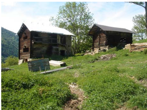
De vieux bâtiments sont rénovés au profit de l'agritourisme