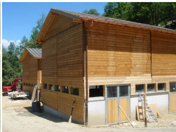
Nouvelles étables sur l'emplacement des anciennes