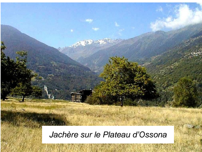
Jachère sur le Plateau d'Ossona

Après l'échec d'un important projet de tourisme, la commune de St-Martin a changé sa stratégie au début des années nonante et a encouragé la mise sur pied d'un tourisme doux et le développement des structures agricoles. En raison d'importantes contraintes agricoles et écologiques, les travaux se sont concentrés dans un premier temps sur les zones situées à proximité du village. Dans le même temps, la commune a fait effectuer une étude sur la revitalisation du Plateau d'Ossona. Le plateau d'Ossona est situé à une altitude d'environ 950 mètres, 400 mètres en contrebas des villages, comprend deux hameaux et compte de nombreux bâtiments d'habitation et de bâtiments d'exploitation abandonnés. Autrefois, le plateau correspondait au premier des 4 niveaux d'exploitation. Au printemps et à la fin de l'automne, les familles rejoignaient le plateau d'Ossona, avec biens et bétail. Les fêtes de l'an qui y étaient célébrées jusqu'au milieu des années 1960 dans l'isolement étaient légendaires. Depuis lors, l'exploitation des terres n'a cessé de reculer. Les bâtiments et les prairies sont de plus en plus abandonnés et seulement utilisés pour le menu bétail.