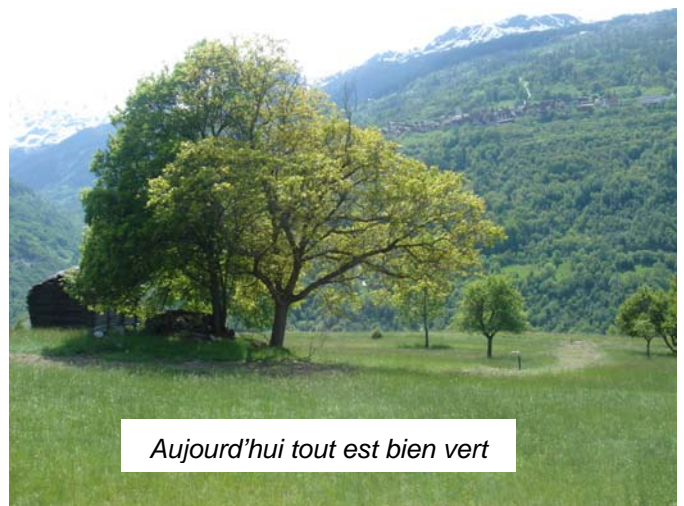
Aujourd'hui tout est bien vert