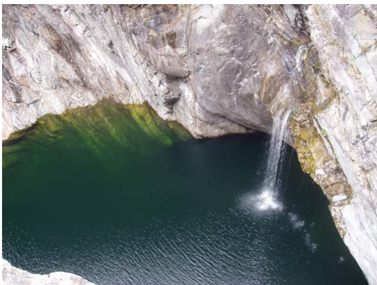
Championnat du monde de plongeon de falaise dans la Maggia

Comme tous les villages des régions périphériques du Tessin, Brontallo a connu deux vagues d'exode, la première au 19 e siècle vers des pays lointains d'outre-mer, la deuxième au milieu du 20 e siècle vers les villes du canton. Contrairement aux autres villages du Val Maggia, la population de Brontallo est toutefois restée stable depuis 25 ans. Il y a peu d'emplois dans le village même. Douze personnes sont occupées dans le secteur primaire. Cinq exploitations agricoles gardent un effectif de 350 chèvres et moutons et quelques génisses. Une grande partie de la population active fait quotidiennement la navette entre le village et Locarno ou Ascona. En 2004, Brontallo a fusionné avec cinq autres fractions pour former la nouvelle commune de Lavizzara. Le village compte aujourd'hui 63 habitants, dont 16 enfants ; la structure d'âge est donc réjouissante et offre de bonnes perspectives.