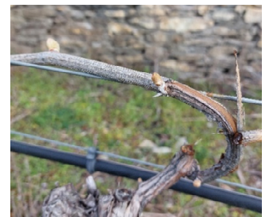
Petite Arvine im Stadium BBCH 05 in der Nähe einer Trockensteinmauer

Die kühleren Temperaturen der letzten Woche haben die Entwicklung der Reben verlangsamt. Die Rebsorten mit frühem Austrieb wie Cornalin und Petite Arvine weisen jedoch ein fortgeschrittenes Stadium BBCH 05, Wolle-Stadium, auf.