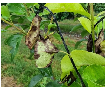
Symptômes sur poirier