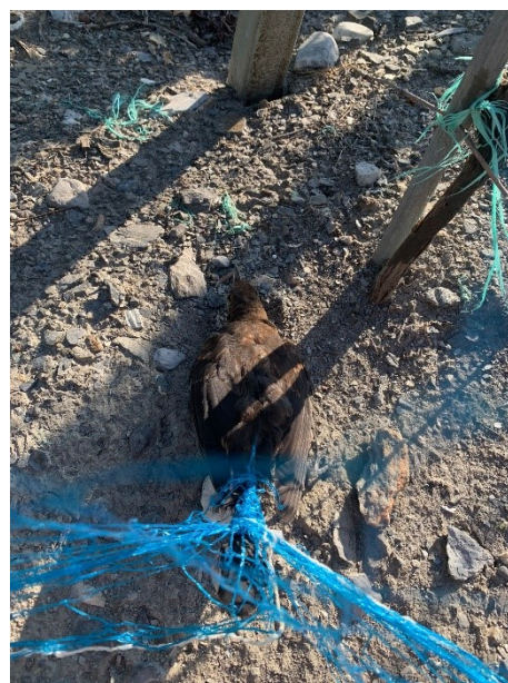
Conséquence d'un filet mal posé : oiseau piégé