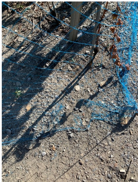
Filet mal posé, l'excédent est au sol

La découverte d'un animal piégé dans un filet peut être annoncé via le formulaire d'annonce sur le site internet swisswine.ch .