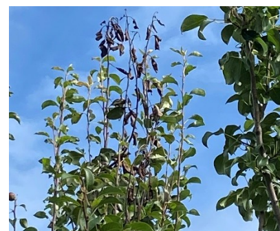
Symptômes sur poirier au sommet

Il est important de s'assurer quelques jours avant le début de la récolte que le verger est exempt de symptômes de feu bactérien.