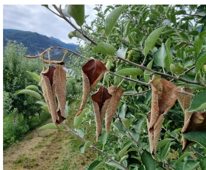
Symptômes sur pommier

Actuellement, on observe des symptômes de feu bactérien très typiques et assez facilement reconnaissables. Pour rappel, tous les symptômes doivent être enlevés le plus rapidement possible, mis dans des sacs en plastique et éliminés par incinération. Au moins 40 à 50 cm de bois sain doivent être supprimés en plus des symptômes visibles, selon la fiche technique n° 738 d'Agroscope .