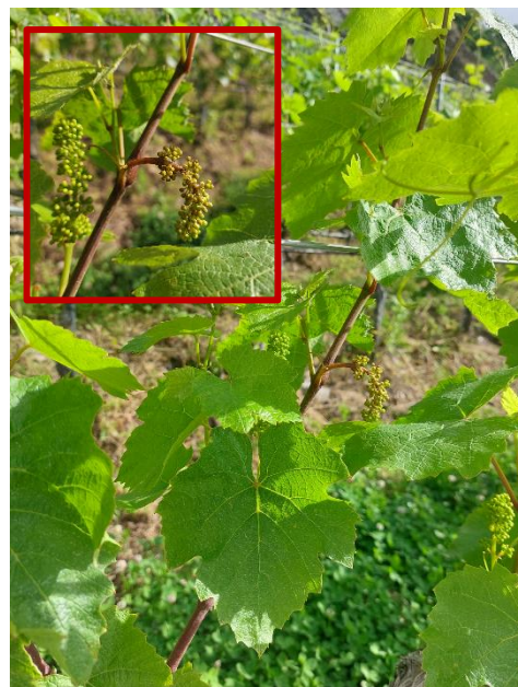
Abbildung 2: Gesunde Gamay-Blätter, vom Falschen Mehltau befallenes Geschein

Seit Ende letzter Woche können neue Ölflecken im Weinberg beobachtet werden. Ursache dafür waren vermutlich die Regenfälle vom 21. bis 23. Mai 2024. Auch neue Verbreitungen von Falschem Mehltau an Gescheine wurden festgestellt. Sie entsprechen den Primärinfektionen vom 16. bis 17. Mai, wobei die Inkubationsphasen auf den Gescheinen um einige Tage länger dauern. Es ist ausserdem möglich, dass die Blätter frei von Ölflecken sind, aber die Gescheine befallen sind ( siehe Abbildung 2 ). Gemäss Agrometeo-Modelle wurden seit einer Woche keine Primärinfektionen (Boden) verzeichnet. Allerdings waren am 30. Mai und am 2. Juni die Bedingungen für Sekundärinfektionen gegeben. Dadurch können am Wochenende möglicherweise neue Flecken beobachtet werden.