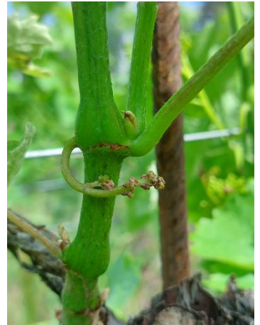
Abbildung 4: Gescheine verdrehen sich

Die Kälteperiode Mitte April führte in einigen Gebieten und Rebsorten zu abgestorbene Gescheine. Die Reben standen unter Stress, der ihr Wachstum auf Kosten der Früchte förderte. In einigen Fällen verlieren die Gescheine fast alle Blütenknospen und ähneln Ranken ( siehe Abbildung 3 ). Es ist auch möglich, dass nur ein Teil der Blütenknospen abstösst, vertrocknet und abfällt.