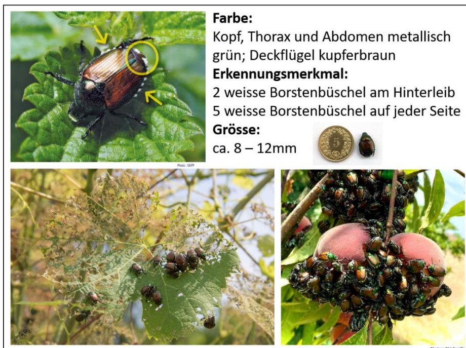
Abbildung 1. Abbildung eines Käfers mit den Merkmalen

In der Schweiz sowie in der EU ist der Japankäfer als prioritärer Quarantäneorganismus eingestuft und ist deswegen melde- und bekämpfungspflichtig. In Zusammenarbeit mit dem Bundesamt für Landwirtschaft wurde eine Befalls- und eine Pufferzone bestimmt, in welchen der Bund Eindämmungsmassnahmen angeordnet hat.