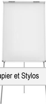
Flip Chart, Papier et Stylos