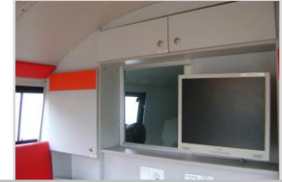
Espace de conduite défini (mobile / stationnaire)