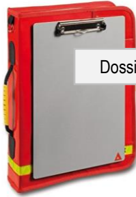
Dossier du chef d'intervention avec les documents

Dispose-t-on d'une installation et d'un équipement minimums pour la conduite d'une intervention en cas d'événement majeur.