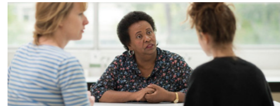
Tableau des cours d'allemand et de français

Lors d'un entretien dans le cadre de la santé, de l'école, d'un service social ou d'autres structures, vous pouvez faire appel à des interprètes certifiés et affiliés à des organismes reconnus. Chaque région linguistique dispose de sa propre structure d'interprétariat.