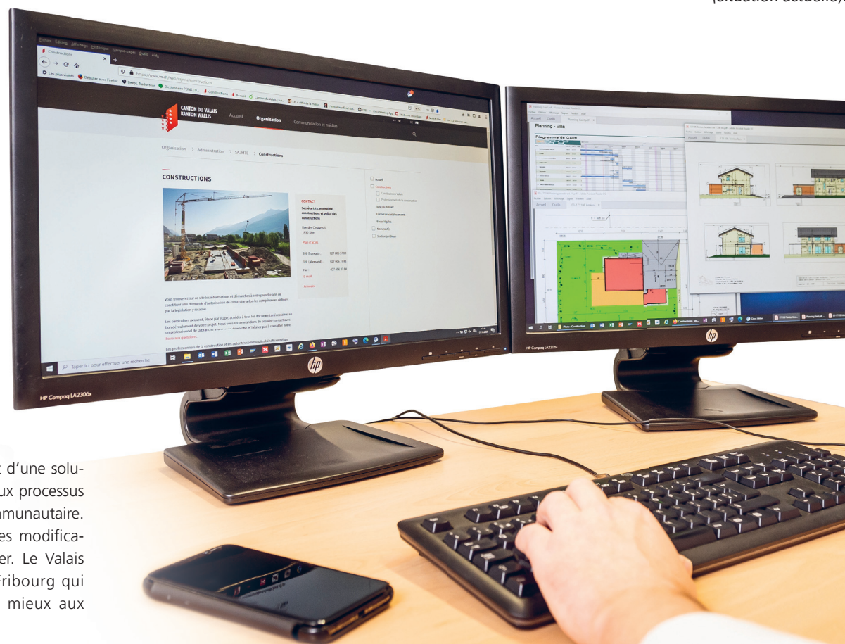
La personne requérante pourra suivre en temps réel l'avancement de son dossier au sein de l'administration cantonale.

Devisé à près de 3 millions de francs, ce projet sera opérationnel d'ici 2022. Il est dirigé par un Comité de pilotage composé de représentants de services