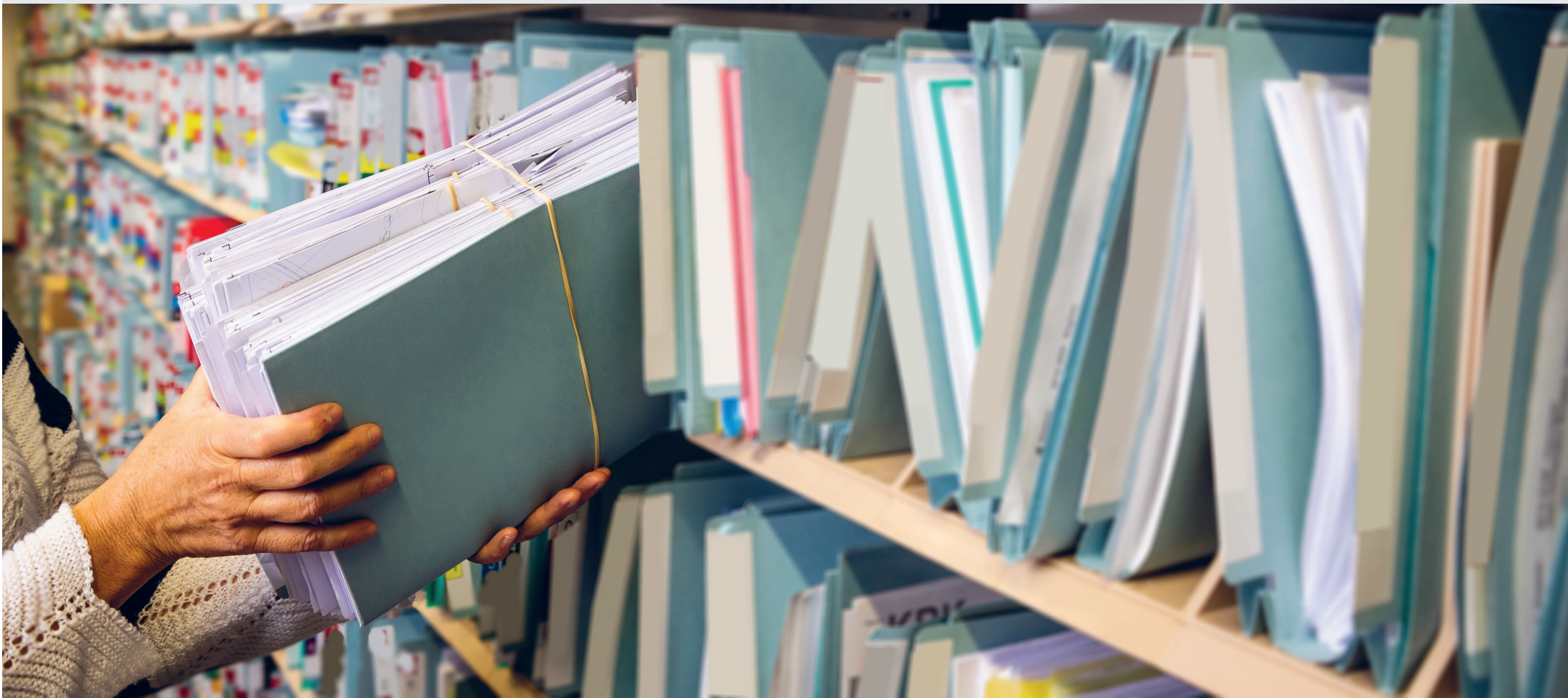
Un dossier de construction au format papier (situation actuelle).

Le monde de la construction n'échappe pas à la numérisation. L'Etat du Valais et les communes valaisannes ont lancé en 2019 un vaste projet devant aboutir à la digitalisation des permis de construire. L'objectif est d'uniformiser et de fluidifier leur gestion, car près d'une quarantaine de services et entités peuvent être amenés à donner leur avis sur un dossier déposé auprès d'une commune ou du canton.