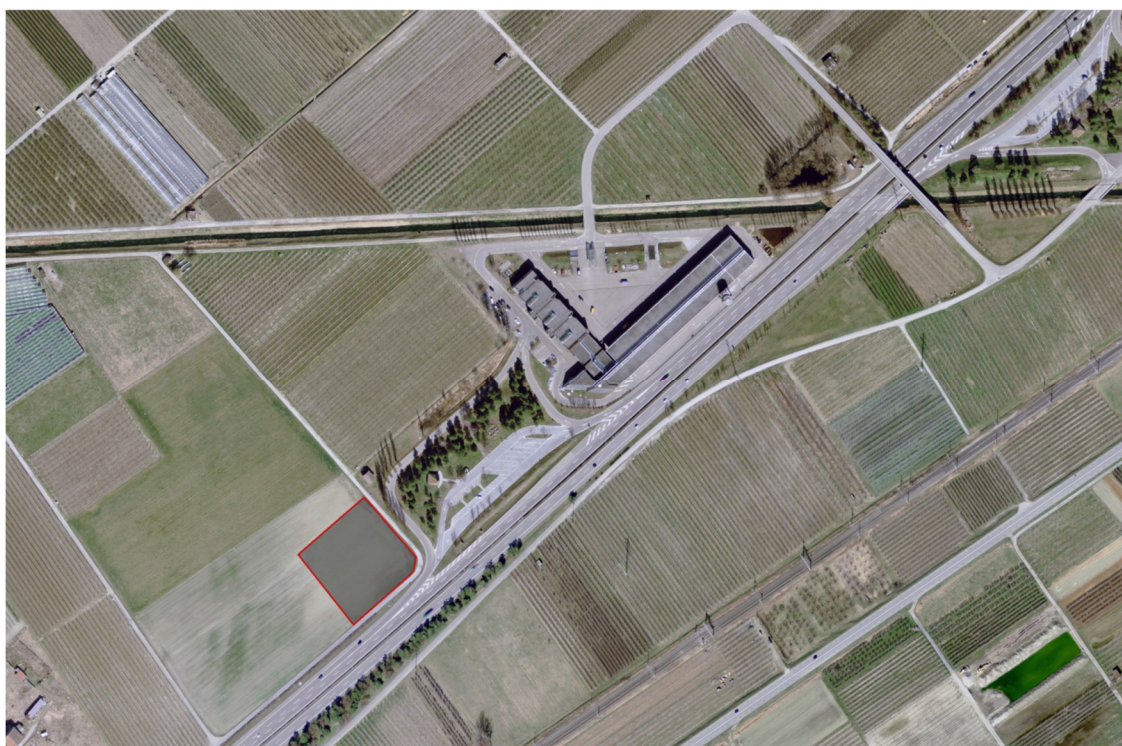
Annexe 1 : plan de situation