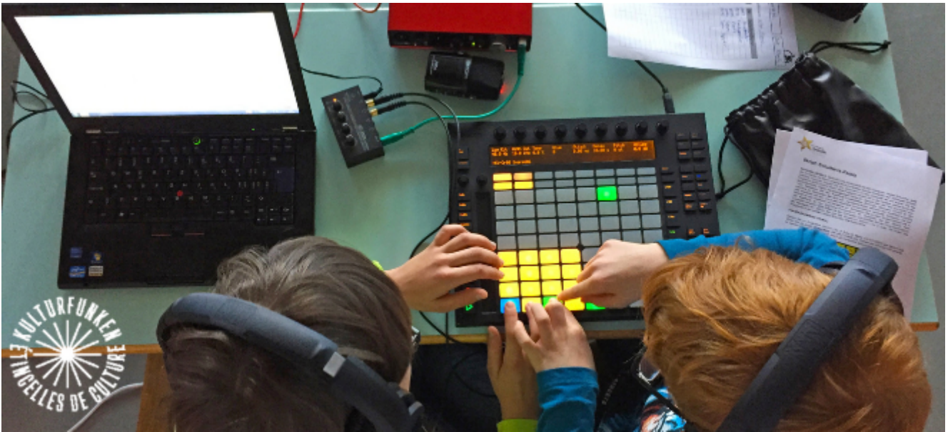
Das fahrende Tonstudio