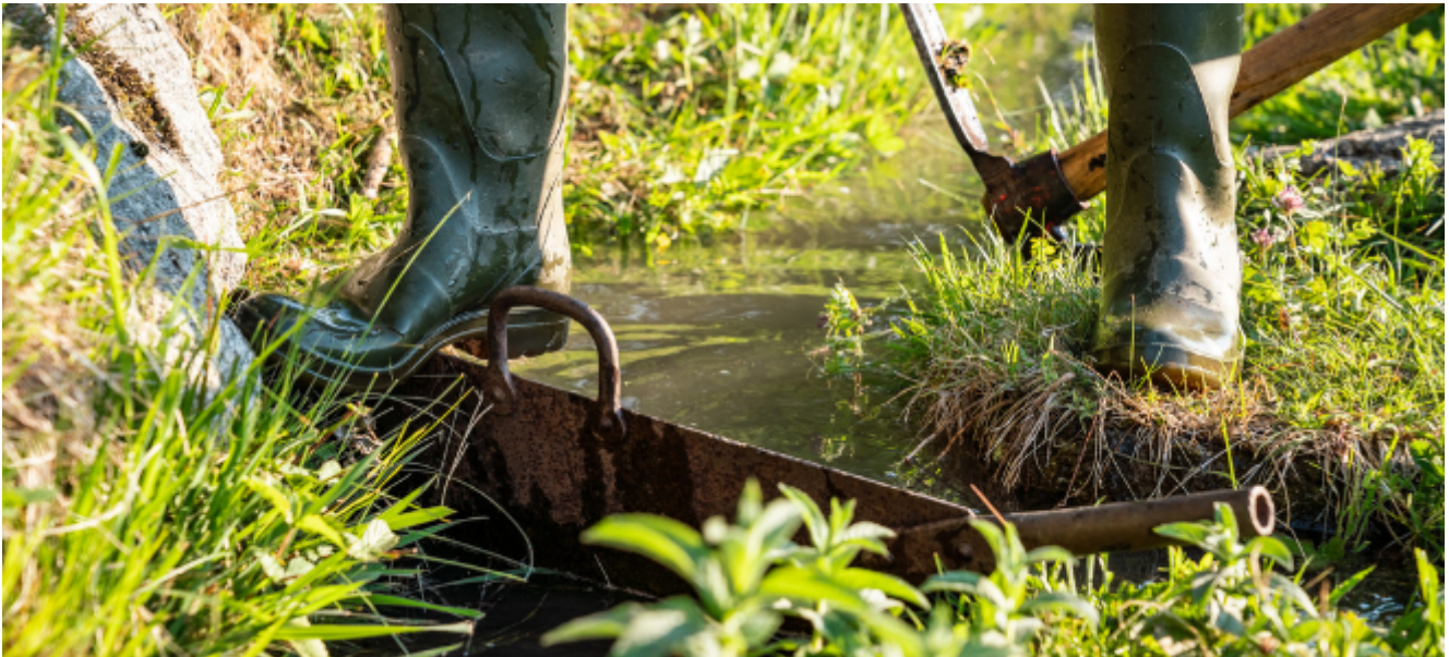
Paysage de pentes irriguées par ruissellement des coteaux ensoleillés du Haut-Valais