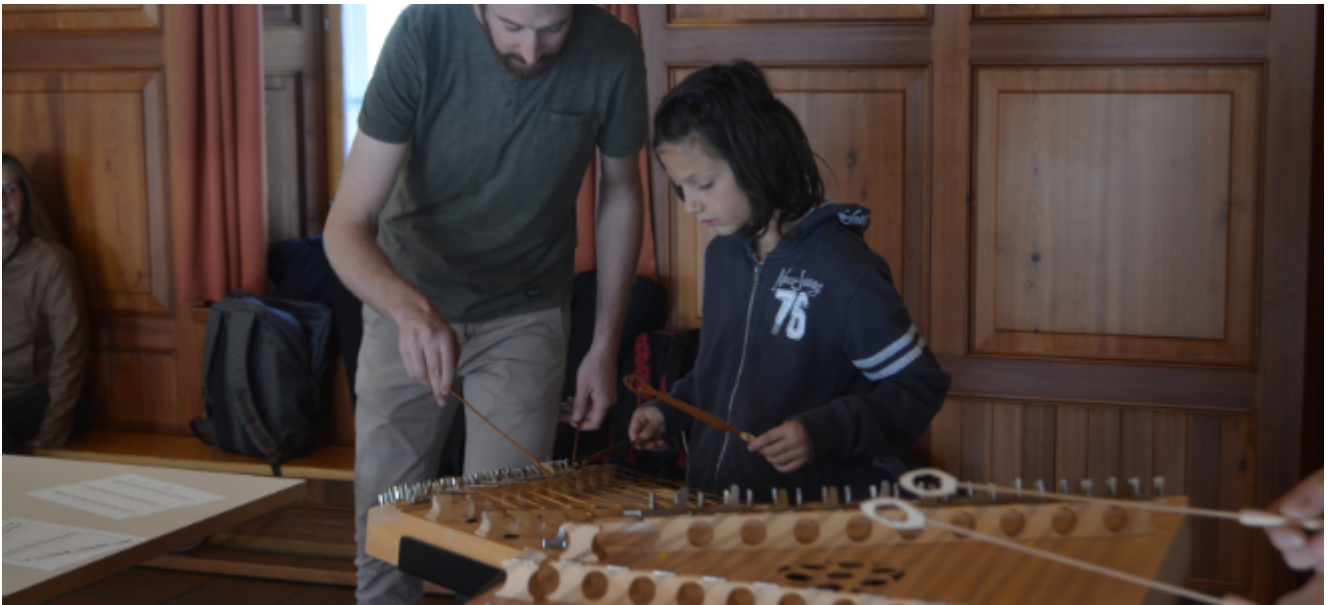
Hackbrett © Andreas Weissen