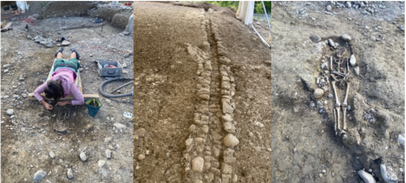
Aufnahmen der Ausgrabungen der Kirche Saint-Laurent, Sommer 2023.

Praktische Informationen und Karte auf www.cafedevalere.ch .