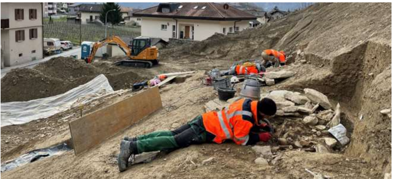
Ausgrabung eines Grabs aus dem Frühmittelalter in Salgesch, Fund im Frühling 2024