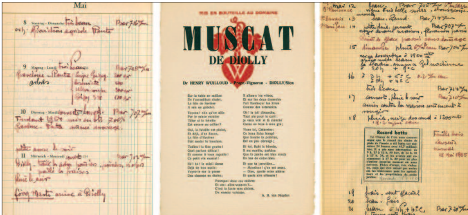
Fig. 7. Documents provenant du fonds Henry Wuilloud.