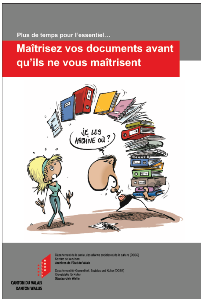
Fig. 4. Page de titre de la brochure Maîtrisez vos documents avant qu'ils ne vous maîtrisent . (Dessin : François Maret)