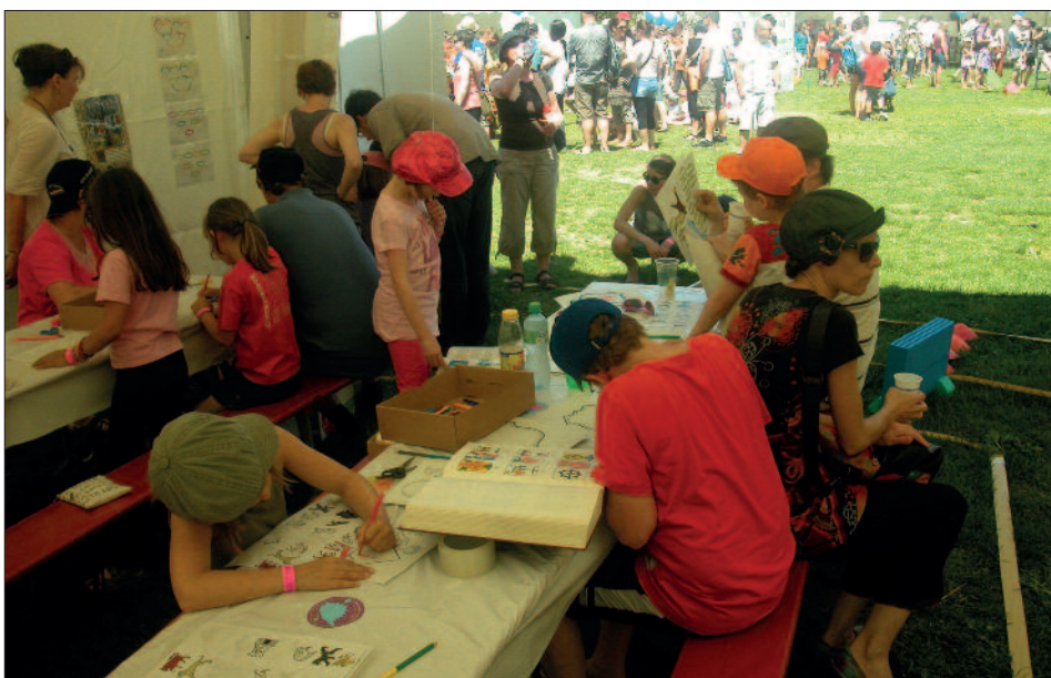
Fig. 8. Le stand des Archives de l'Etat du Valais au festival Hérisson sous gazon.

Fort du succès enregistré en 2013, les Archives de l'Etat du Valais ont renouvelé leur participation au festival Hérisson sous gazon, destiné aux enfants et aux familles, en y étant présentes durant tout le week-end (14-15 juin). Au programme, trois ateliers qui ont permis aux nombreux enfants présents et à leurs familles d'explorer le passé de leur famille et de reconstituer leur arbre généalogique, de découvrir les secrets des armoiries, de réinventer leur propre blason et de réaliser des sceaux en plâtre, ou encore de rechercher sur les cartes anciennes des lieux-dits actuels.