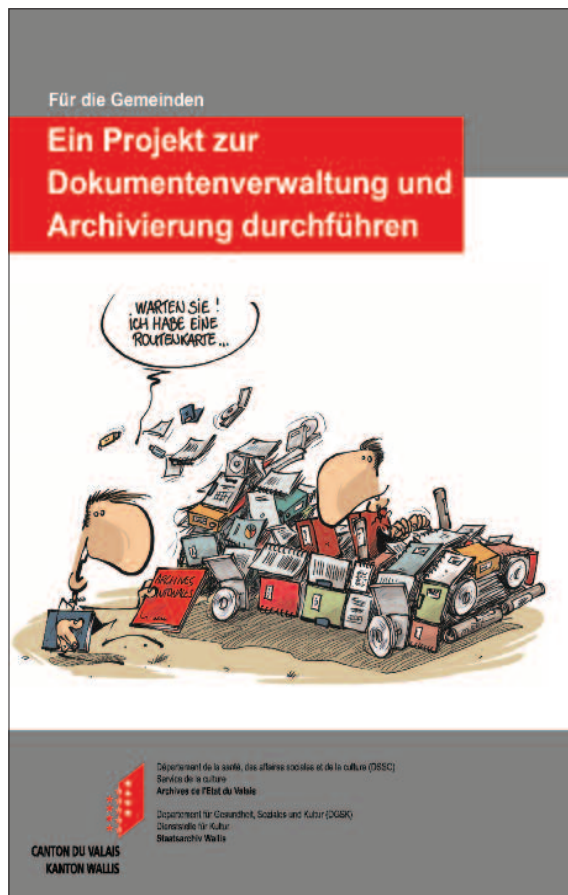
Fig. 5. Page de titre de la brochure Ein Projekt zur Dokumentenverwaltung und Archivierung durchführen . (Dessin : François Maret)

documents de la commune de manière ordonnée. Elle aborde ainsi, sous forme succincte, des questions aussi essentielles que l'utilité de mettre en œuvre un système de gestion des documents, la définition du cycle de vie des documents, les prérequis indispensables pour gérer les dossiers d'une commune sous forme entièrement électronique ou encore l'exigence de respecter les durées d'utilité légale et administrative. Quant à la seconde brochure, Conduire un projet de gestion des documents et des archives / Ein Projekt zur Dokumentenverwaltung und Archivierung durchführen , elle présente une méthodologie en dix points et en trois étapes pour mettre en œuvre un système complet de gestion des documents (préparation du projet, mise en place d'un système de gestion des documents et gestion des archives).