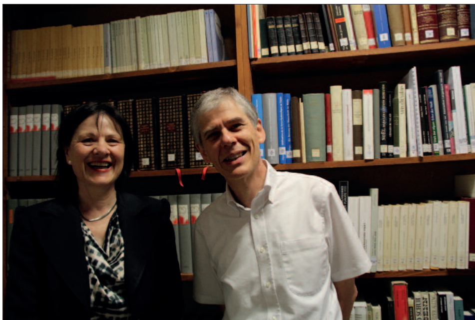
Fig. 3. Esther Waeber-Kalbermatten, cheffe du Département de la santé, des affaires sociales et de la culture, et Hans-Robert Ammann, archiviste cantonal, lors de la conférence de presse du 17 juin 2014.

Dans le sillage de l'entrée en vigueur de la Loi sur l'information du public, la protection des données et l'archivage du 9 octobre 2008, qui donne notamment pour mission aux autorités cantonales, communales et bourgeoises de gérer leurs documents de manière ordonnée, les Archives de l'Etat du Valais ont développé une politique active de conseil et de soutien dans le domaine de la gestion des documents auprès des unités administratives de l'Etat du Valais et des communes municipales et bourgeoises. Cette politique s'est concrétisée en 2014 par la publication de deux Guides de gestion des documents et des archives à leur intention, qui a fait l'objet d'une conférence de presse en présence de M me Esther Waeber-Kalbermatten, cheffe du Département de la santé, des affaires sociales et de la culture.