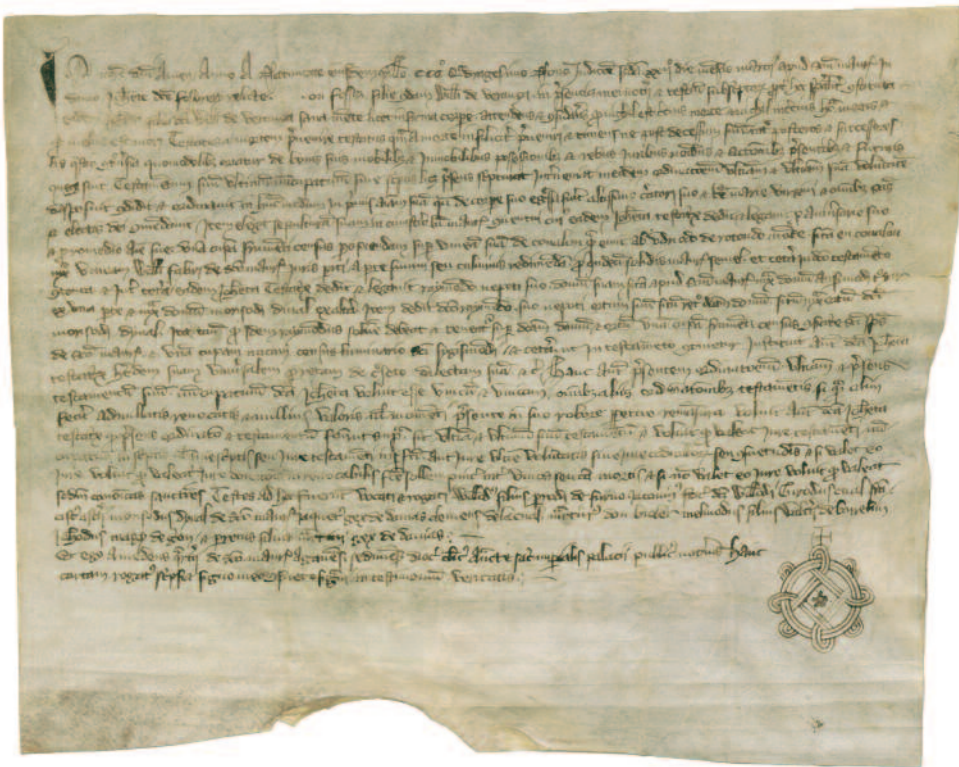
Fig. 6. Testament de la période de la peste noire (22 mars 1349) (AEV, AC/AB Saint-Maurice, Pg 243).