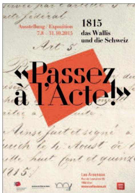
Fig. 5. Affiche de l'exposition Passez à l'Acte! 1815, das Wallis und die Schweiz .

L'exposition Passez à l'Acte! 1815, das Wallis und die Schweiz s'est déroulée aux Arsenaux du 7 août au 31 octobre 2015; elle a suivi une intense phase de préparation, qui avait débuté en novembre 2014 déjà. Elle a été accompagnée par un riche programme d'actions de médiation culturelle (visite commentée, ateliers