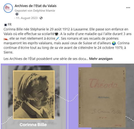
Fig. 1. Publication consacrée à Corinna Bille sur Facebook.

A diverses occasions et de manière continue tout au long de l'année, des séries de « posts » permettent également de mettre en valeur les fonds conservés, les activités des archivistes ou encore des thématiques d'actualité. C'est ainsi qu'en 2023, des séries sur les femmes valaisannes (Berthe Roten-Calpini, peintre ; Lucile Muston, aubergiste à Sion ; Corinna Bille, autrice et poétesse ; Marie Mory-Debons, œnologue ; etc.) ou sur les glaciers valaisans ont été produites et mises en ligne. Les AEV se font en outre l'écho de séries de publications des archives de la Bourgeoisie de Sion (série « Trouvailles d'archives ») ou de la Documentation valaisanne (série « Pépites du patrimoine »).