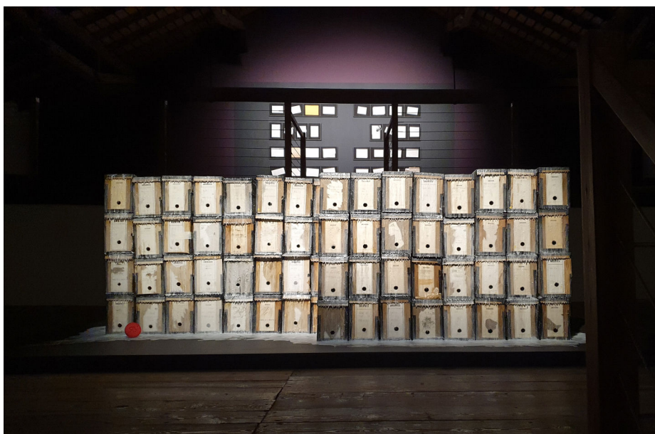
Fig. 2 et fig. 3. Deux des œuvres créées par Virginie Rebetez pour l'exposition La Levée des corps .