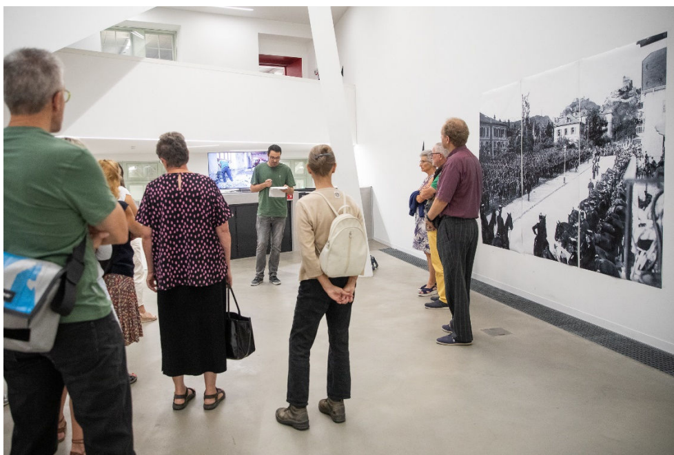
Fig. 5. Présentation des Arsenaux lors des Journées européennes du patrimoine, le 9 septembre 2023.