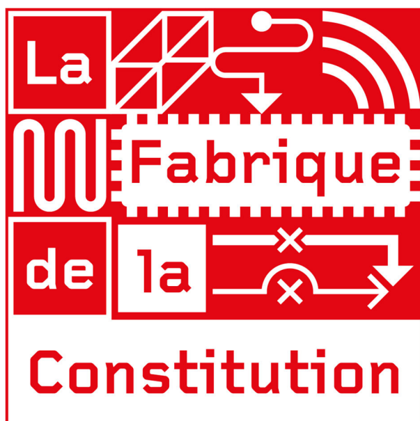
Fig. 4. Affiche de l'exposition La Fabrique de la Constitution .

Cette exposition a donné lieu à des prolongements sous forme vidéo et à un reportage de Canal9 ainsi qu'à un article du Nouvelliste .