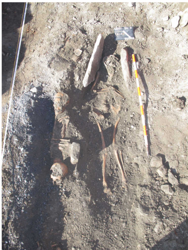
Fig. 7. Saillon, St-Laurent. Deux dalles de chant protègent la tête et les épaules du défunt de la tombe T3. A gauche, les tombes T4 et T5 ont été en partie perturbées par la tranchée de 2006.