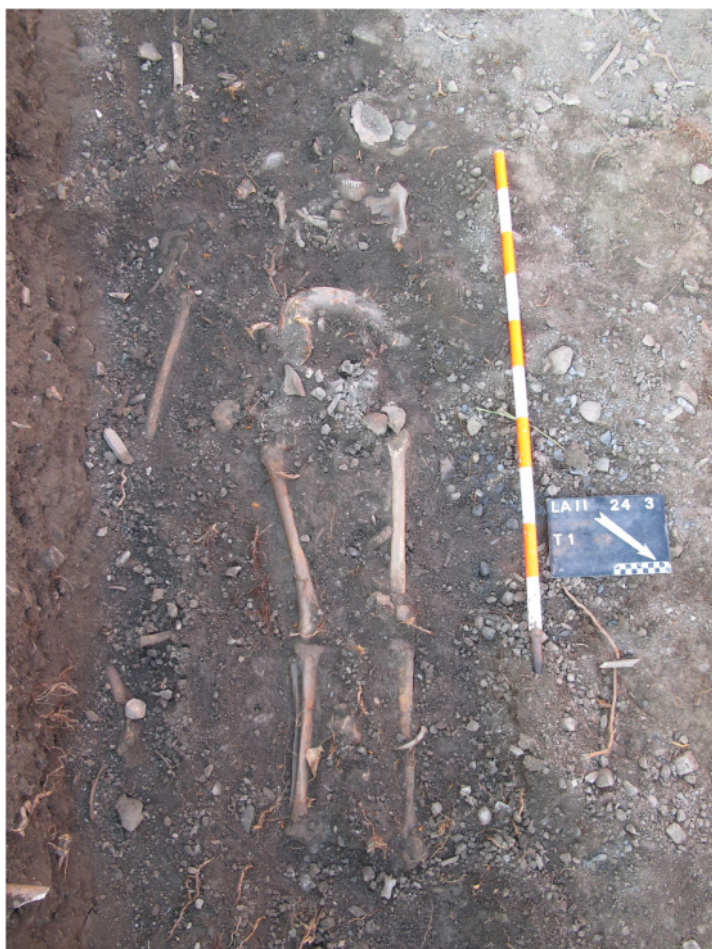
Fig. 5. Saillon, St-Laurent. La tombe T1 est probablement une sépulture en pleine terre.