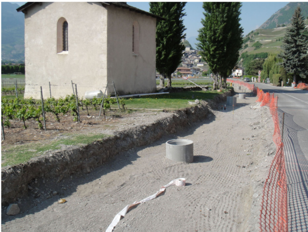
Fig. 3. Saillon, St-Laurent. Tranchée après remblaiement de l'excavation pour les eaux claires. Les regards en béton jalonnent le tracé de celle-ci. En arrière plan le bourg de Saillon. Vue depuis l'est.