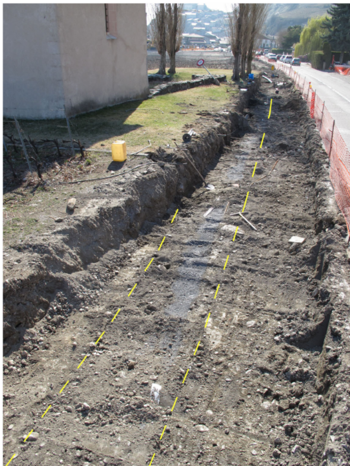
Fig. 4. Saillon, St-Laurent. La tranchée de 2006 est délimitée par les traits tirés jaunes. A gauche de celle-ci apparaissent les alluvions fines de la Salentze, tandis qu'à droite, présence de gravats liés à des perturbations modernes. Vue depuis l'est.