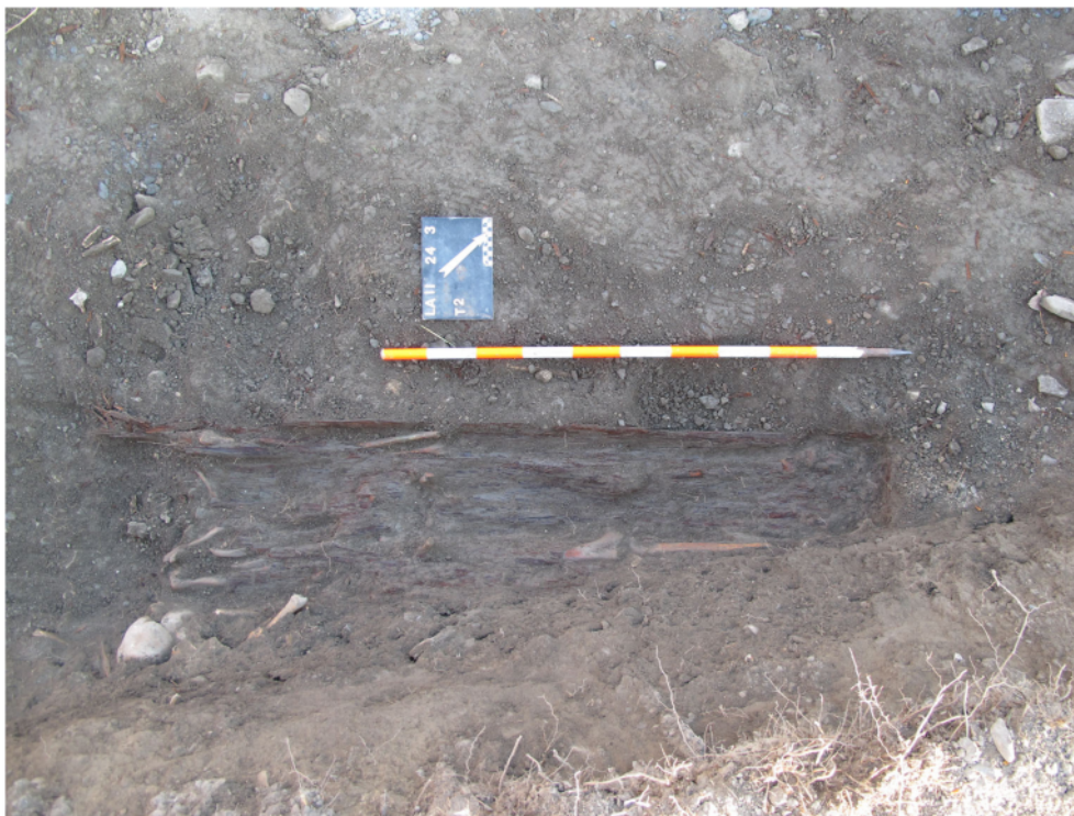
Fig. 6. Saillon, St-Laurent. La tombe T2 est constituée d'un cercueil dont le bois est dans un état de conservation remarquable. Un collier en fer a été retrouvé au niveau du crâne du défunt.