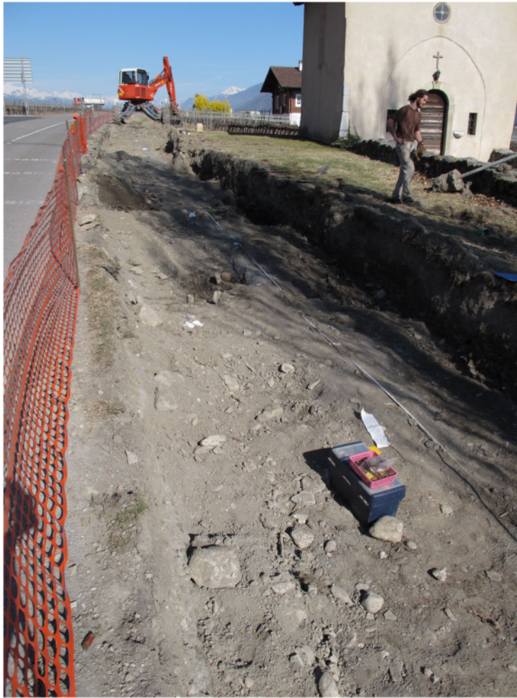
Fig. 2. Saillon, St-Laurent. Travaux d'élargissement de la route menant à Leytron. Vue depuis l'ouest.