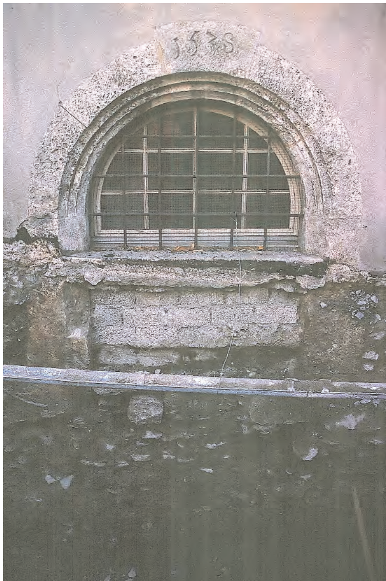
Fig.1 Sion, av. Ritz 16, façade ouest, détail de la porte