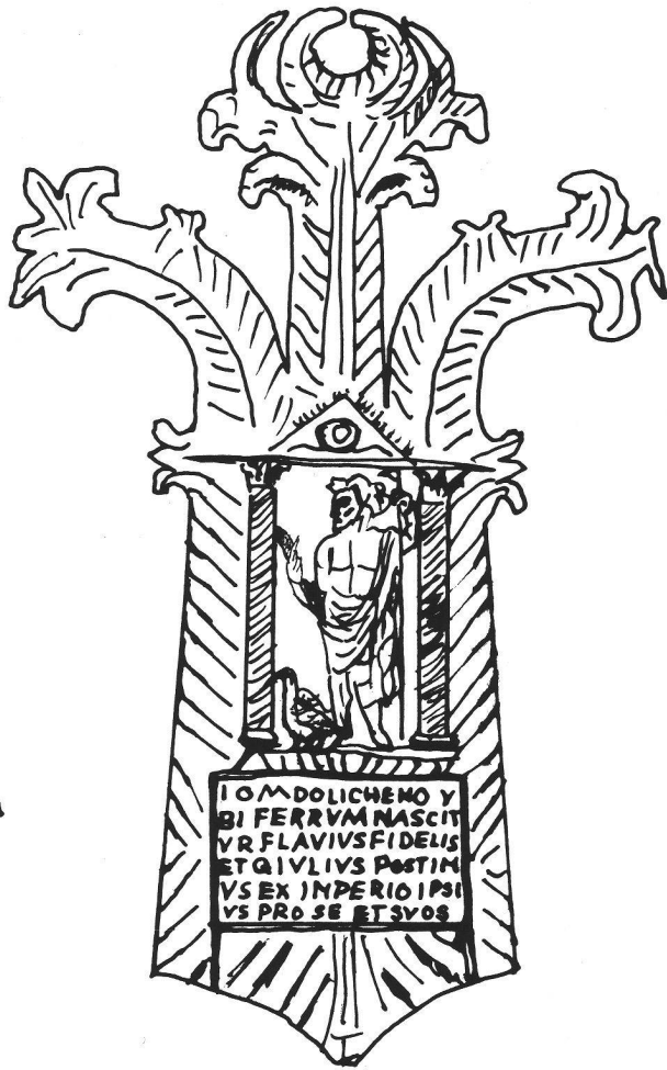
Abb. 3 Nachzeichnung des silbernen Ex-Voto-Plättchens für Jupiter Dolichenus von Mauer an der Url, Niederösterreich (Kunsthistorisches Museum Wien). Nach M.-P. Speidel, Jupiter Dolichenus (1980) Abb. 40. Dessin de l'ex-voto en argent dédié à Jupiter Dolichenus de Mauer an der Url. Disegno dell'ex-voto d'argento dedicato a Jupiter Dolichenus di Mauer an der Url.