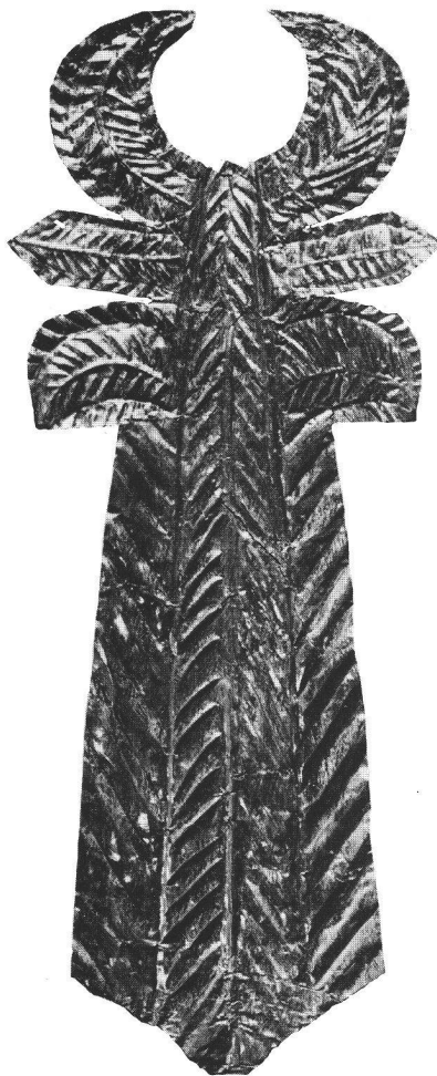
Abb. 2 Goldenes Ex-Voto-Plättchen vom Tempelbezirk Allmendingen bei Thun. M. 1:1. Stilisierter Baum mit Blattwerk und Mondsichel. Der Typus solcher silberner und goldener Ex-Voto-Folien wird in den Tempeln orientalischer Gottheiten deponiert. Sie kommen mit oder ohne Inschrift des Stifters vor. Ex-voto en or de Thun-Allmendingen. Ex-voto d'oro del santuario di Thun-Allmendingen.