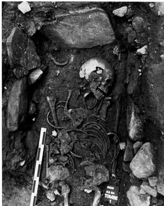
fig. 3 Sion, Sous-le-Scex. Tombe avec entourage de dalles. Bronze ancien. Von Steinplatten umstelltes Grab aus der frühen Bronzezeit. Tomba delimitata da lastre. Età del Bronzo iniziale.

Les fouilles de ce sondage se poursuivent actuellement en surface d'un niveau à gros galets fluviaux. Le matériel récolté dans ces divers niveaux et notamment l'abondance de la faune montre que nous sommes en présence de niveaux d'habitations. Les nombreuses sépultures rencontrées nous apprennent pourtant que la base du rocher était également une zone funéraire