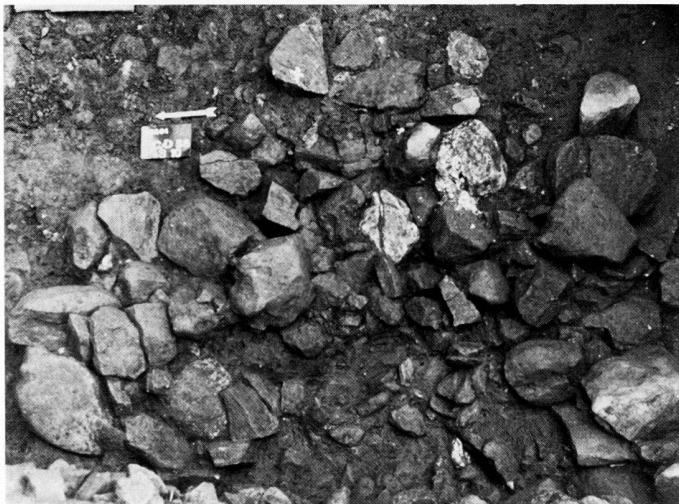
fig. 2 Sion, Sous-le-Scex. Foyer en cuvette. Néolithique moyen. Herdstelle aus dem mittleren Neolithikum. Focolare del Neolitico medio.