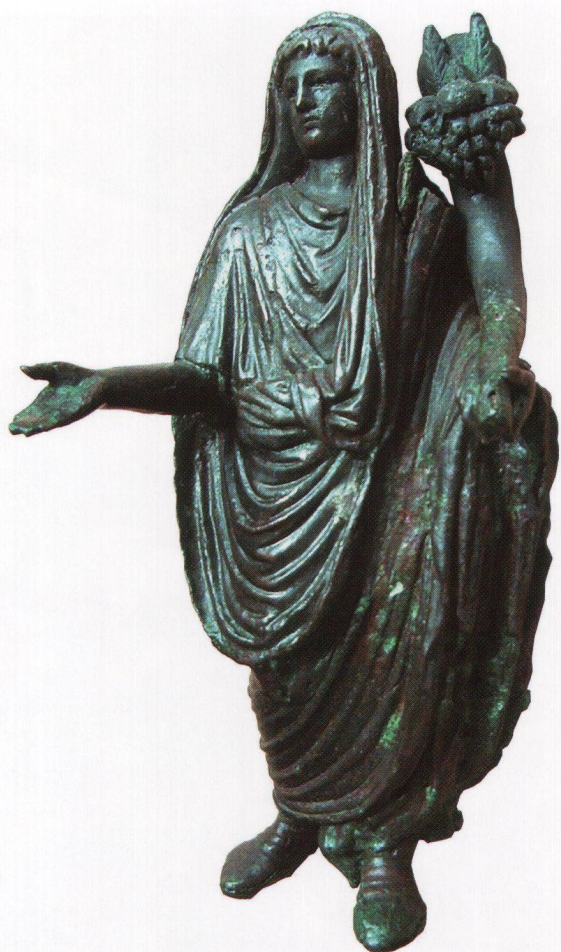
Fig. 2 Génie domestique, statuette en bronze ayant donné son nom à la domus à péristyle de l' insula 8 (en face du forum).

Schutzgott des Hauses, Bronzestatue, die der Domus mit Peristyl der Insula 8 (gegenüber dem Forum) den Namen gegeben hat.