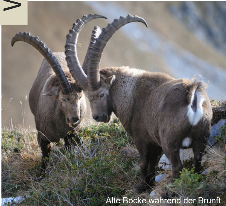
Alte Böcke während der Brunft

Die Steinböcke gehören wie die Gämsen zu den Hornträgern. Lebenslang werden die Hörner im Sommerhalbjahr ein paar Zentimeter nachgeschoben. Durch den Wachstumsunterbruch im Winter entstehen gut sichtbare Jahrringe (Einschnürungen) auf der Rückseite der Hörner, welche eine zuverlässige Altersbestimmung ermöglichen.