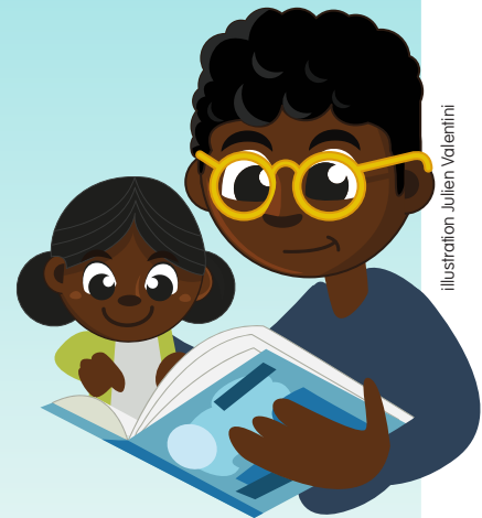
Illustration: Julien Valentini