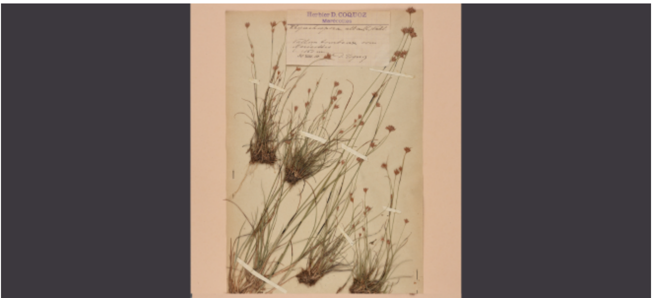
Rhynchospora blanc ( Rhynchospora alba (L.) Vahl, n° Inv SION000326), récoltée par Denis Coquoz en 1919 sous Les Marécottes, avant sa restauration. Le milieu qui abritait cette plante rare de marais, situé dans les environs du zoo, a aujourd'hui disparu.

Ancré dans la loi sur la promotion de la culture depuis 1996, le Plan directeur des bibliothèques a permis aux bibliothèques valaisannes de se développer de manière exemplaire, de se fédérer et d'entrer dans l'ère du numérique en travaillant ensemble sur la qualité des services offerts au public. Avec le label Valais Excellence, promu par l'association faîtière BiblioValais, celles-ci se sont hissées parmi les entreprises innovantes de notre canton et ont démontré leur engagement vers un accueil professionnel. Les différentes parties prenantes seront invitées dès ce printemps à des séances de réflexion. Elles seront encouragées à répondre à des questions fondamentales sur l'évolution des bibliothèques, à l'heure du web 4.0. Quelle place occupera la bibliothèque du futur ? Quels liens entretiendra-t-elle avec ses usagers ? Quelle offre culturelle et éducative proposera-t-elle ? Quelles prestations, et fondées sur quelles valeurs ? Ces moments d'échange et de partage permettront de faire le bilan du quatrième Plan directeur et d'impliquer à la fois les utilisateurs et les professionnels des bibliothèques dans une vision d'avenir. Cependant, le but final restera toujours de "servir tous les citoyens dans les domaines de l'éducation et de la culture, et de créer des lieux et des services accessibles à tous", selon le communiqué de presse paru en 2019. La Médiathèque Valais se réjouit d'accompagner cette révision.