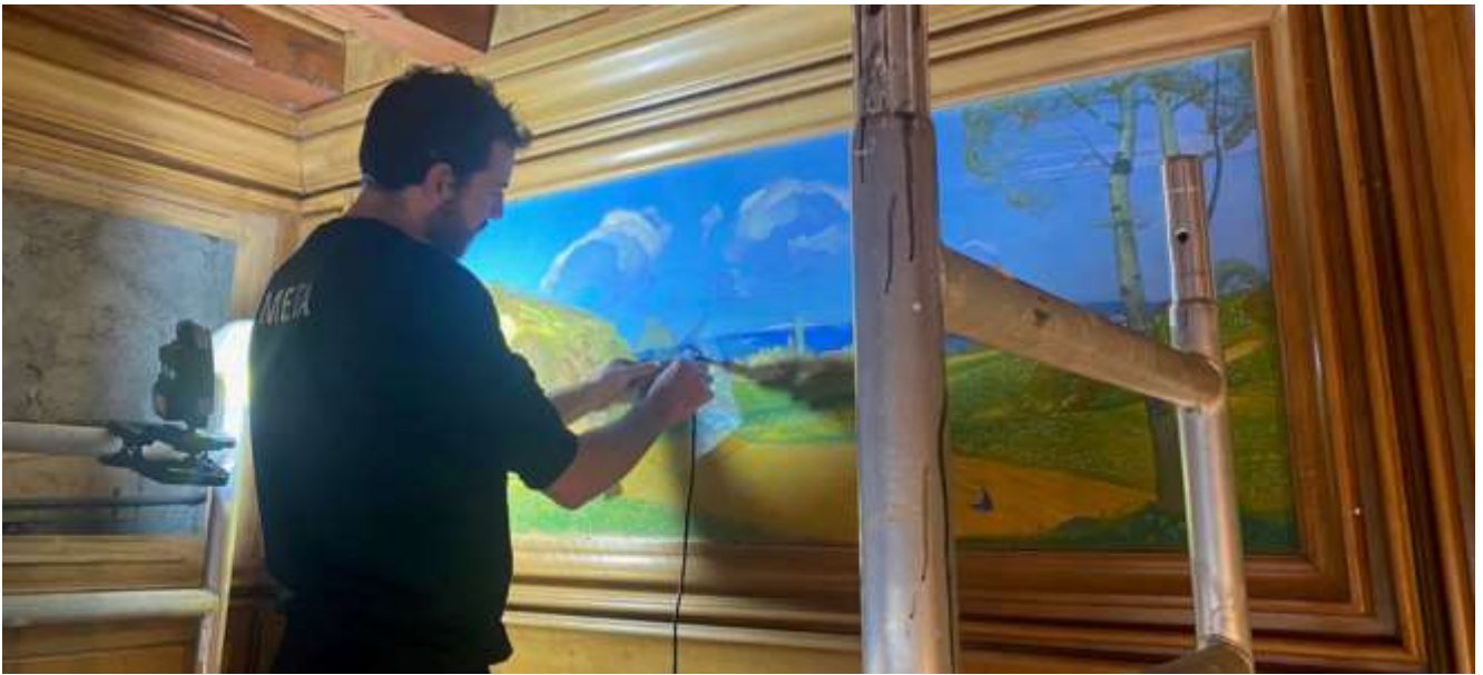
Konsolidierender Eingriff, Esszimmer, Château Mercier