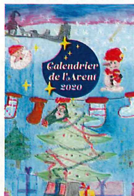
Calendrier de l'avent L'éducation donne de la force