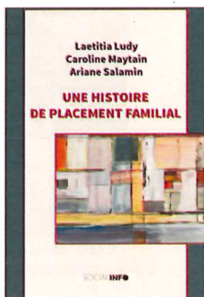
Livre sur les placements familiaux