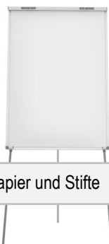
Flip Chart, Papier und Stifte