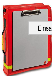
Einsatzleitermappe mit den offiziellen Unterlagen

Ist eine minimale Einrichtung und Ausrüstung für die Einsatzführung eines grösseren Ereignisses vorhanden.