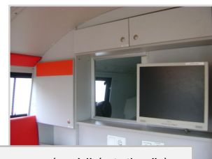
Definierter Führungsraum (mobil / stationär)