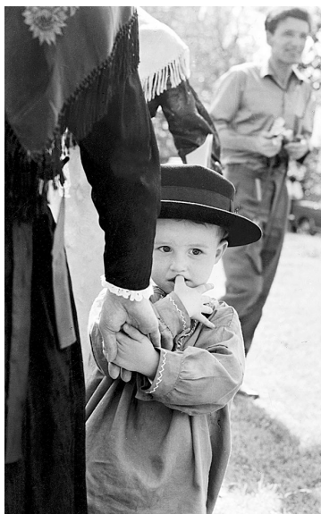
XIIème Fête des patois romands, Bluche-Randogne, 1965