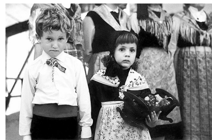
© Pascal Thurre, Treize Etoiles, Médiathèque Valais - Martigny XIIème Fête des patois romands, Bluche-Randogne, 1965