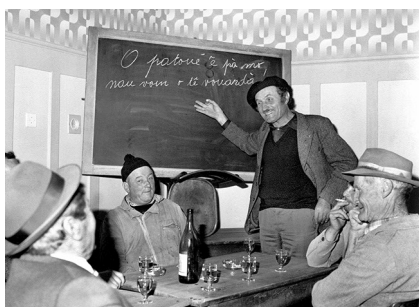
Cours de patois par Louis Bertrouez, Conthey, vers 1978