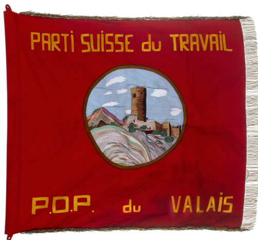
Drapeau du Parti Ouvrier Paysan (Parti du Travail), section Martigny — La Bâtiaz, 1948, 90 x 97.5 cm (sans les franges), Musée d'histoire du Valais, Don René Duchoud, MV 11972a