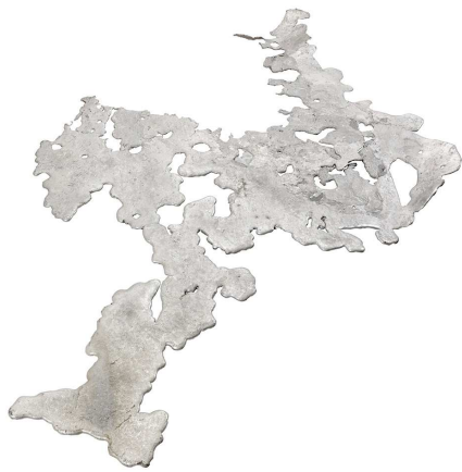
Résidu de fonte provenant de la fonderie d'aluminium de Chippis, sans date, Gussrückstand der Aluminiumgiesserei in Chippis, ohne Datum, 156 x 136 cm Constellium Valais SA, Archives AIAG.