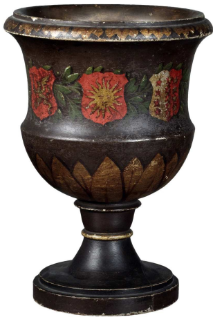
Urne de vote du Grand Conseil utilisée jusqu'en 1995 Bois tourné et peint, hauteur 32 cm, diamètre 23 cm Musée d'histoire du Valais, MV 8689a

>>> stehen auf unserer Website zur Verfügung: www.vs.ch/kultur > Kommunikation und Medien > Medienmitteilung