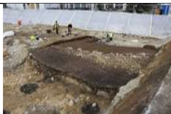
Fig. 3: L'épaisse couche noire est liée à l'accumulation de rebus autour des maisons néolithiques; au premier plan, on peut apercevoir trois grandes fosses creusées par les habitants du village néolithique pour stocker leurs réserves de céréales, puis remplies de rebus après leur abandon.