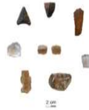
Fig. 8: Pointes de flèches et autre outils taillés, en cristal de roche et en silex