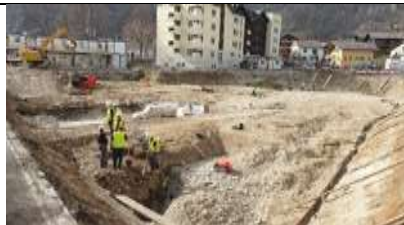
Fig. 1: Vue du chantier au terme des travaux de terrassement réalisés à l'aide d'une pelle mécanique; les premiers niveaux archéologiques commencent à faire leur apparition.

>>> téléchargeables sur le site https://www.vs.ch/web/culture/infos-medias