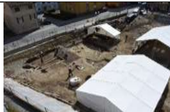
Fig. 2: Dégagement des niveaux archéologiques; le chantier est divisé en plusieurs rectangles de 9x12 mètres, fouillés successivement.