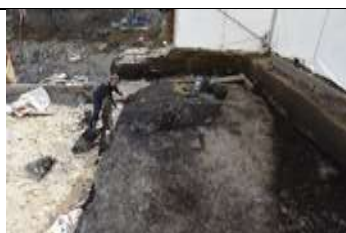
Fig. 5: La fouille fait également apparaître de nombreuses fosses et trous de poteaux (petites taches noires d'une vingtaine de centimètres de diamètre); ces traces de trous de poteaux correspondent à des bâtiments dont il ne reste que les fondations.