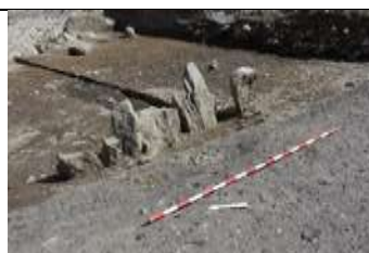
Fig. 6: La fonction de cette rangée de dalles dressées est encore inconnue; il s'agit peut-être de la limite d'un champ ou d'un jardin.