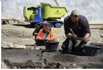
Fig. 7: Le travail de terrain nécessite beaucoup de concentration, que ce soit au cours de la fouille (au premier plan) ou lors de la documentation graphique (au second plan).