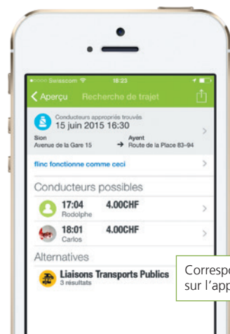
Correspondances des TP sur l'application flinc

En complément au covoiturage, flinc vous propose également les correspondances adéquates en transport public. Lors de votre consultation d'horaire, l'application CarPostal vous présente en un clin d'œil les correspondances des transports publics et les offres de covoiturage. Les conducteurs et les passagers peuvent se contacter directement et préciser les détails de leur trajet commun. Enregistrez-vous gratuitement et n'hésitez pas à tester le système!