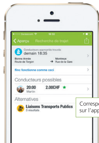
Correspondances des TP sur l'application flinc

En complément au covoiturage, flinc vous propose également les correspondances adéquates en transport public. Lors de votre consultation d'horaire, l'application CarPostal vous présente en un clin d'œil les correspondances des transports publics et les offres de covoiturage. Les conducteurs et les passagers peuvent se contacter directement et préciser les détails de leur trajet commun. Enregistrez-vous gratuitement et n'hésitez pas à tester le système!