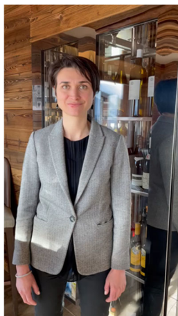
Chandolin Boutique Hôtel