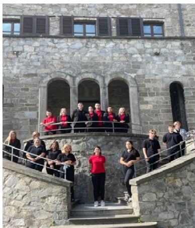
Premier échange à Aoste