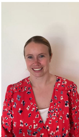
Le Soleil de Dugny