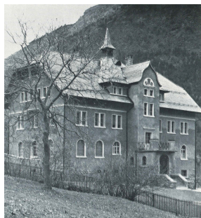
Bâtiment d'origine de 1934