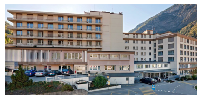
Agrandissement de l'aile Est en 1986