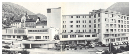
Agrandissement de l'aile Ouest en 1973