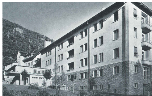
Nouveau bâtiment en 1953