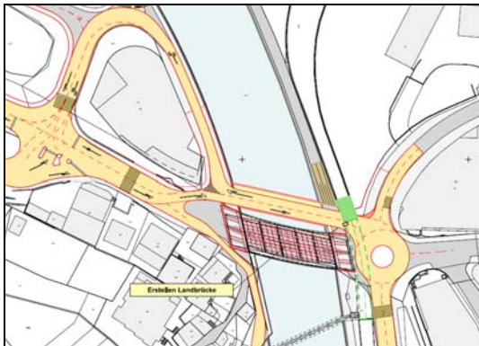
Bauphase: Ersatz der Landbrücke