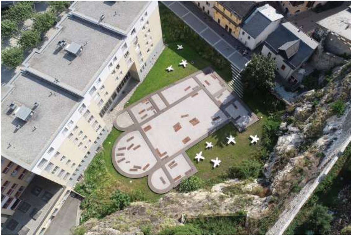
Drohnenaufnahme des im September 2020 öffentlich zugänglich gemachten Platzes