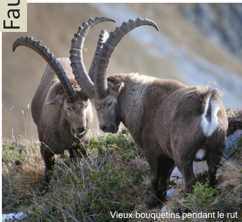
Vieux bouquetins pendant le rut

Les bouquetins, comme les chamois, appartiennent à la famille des bovidés. Tout au long de leur vie, leurs cornes poussent de quelques centimètres durant la période d'été. L'interruption de la croissance en hiver entraîne l'apparition des anneaux de croissance (stries annuelles) sur l'arrière des cornes; ceux-ci permettent de déterminer leur âge avec précision.